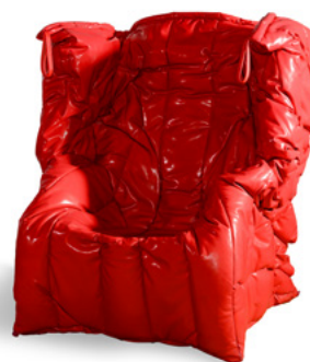
Shadow Red - S3870