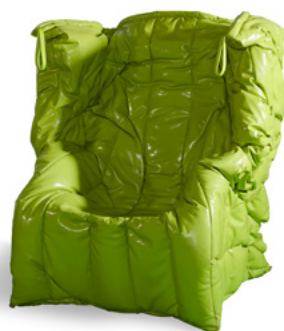
Shadow Green - S4770