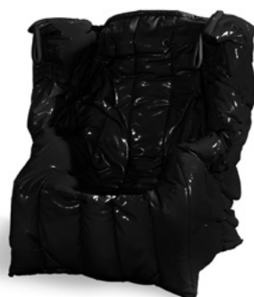
Shadow Black - S5270