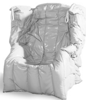
Shadow White - S3170