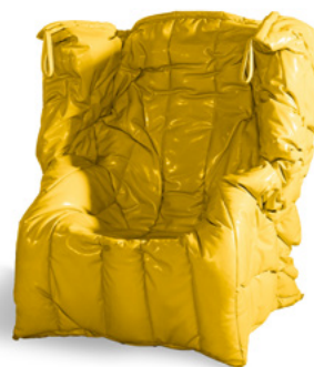
Shadow Yellow - S3670